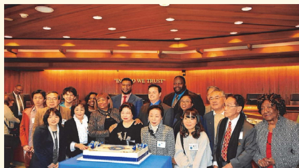
カーソン市制50周年記念式典に出席 カーソン市長、議員の皆さんとともに 2018年2月20日 於 カーソン市議会議場