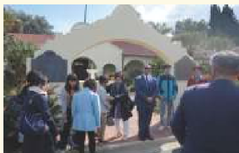
アドビミュージアム(カーソン市歴史博物館) を訪問カーソン市の歴史を学ぶ 2018年2月21日