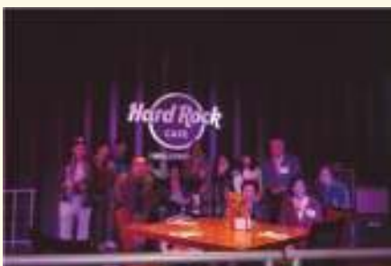
ハリウッド市内見学 Hard Rock CAFEで元カーソン姉妹都市協 会会長と昼食 2018年2月22日