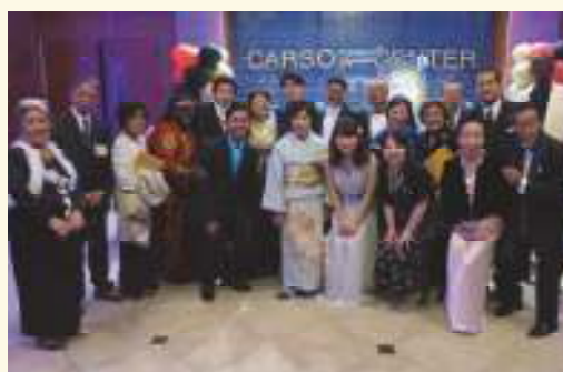
カーソン市姉妹 都市協会の皆さん と記念撮影