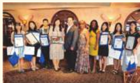
平成29年度青少年海外派遣団員と アルバート・ロブレス カーソン市長 (さよならパーティ)

カーソン市と草加市の交流は、青少年相互派遣を中心に進められてきました。第1回草加市青少年海外派遣団11名が1981(昭和56)年にカーソン市を訪問。以降、37年間にわたり、青少年の派遣が15回・受入が14回行われ、ホームステイを通して、お互いの文化、習慣、教育などに関する相互理解を深めてきました。