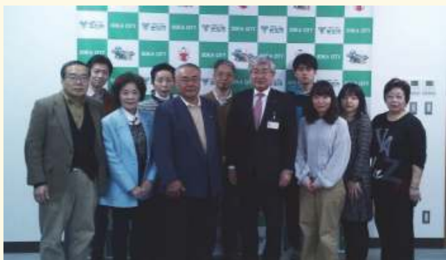
カーソン市制50周年祝賀市民交流使節団結団式 平成30年2月20日 於 草加市役所市長公室